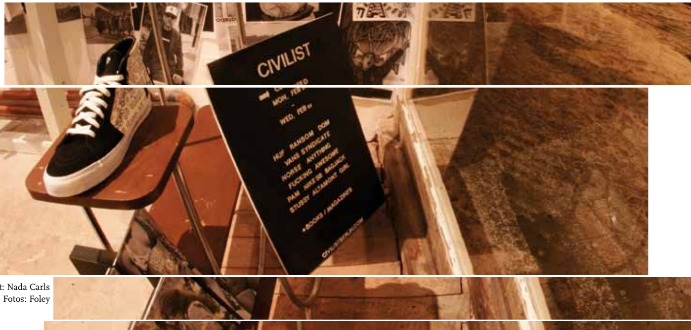
Text: Nada Carls